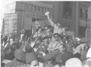
عبد الناصر في إحدى جولاته الجماهيرية